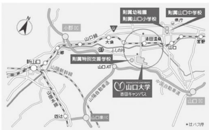
■山口大学 吉田キャンパス

・山口宇部空港 新山口駅行きバス乗り場→宇部市営バス(特急)37 分→JR 新山口駅(終点)、乗換(5 番バス乗り場)→防長バス平川経由 30 分→山口大学前バス停→徒歩 3 分→吉田キャンパス